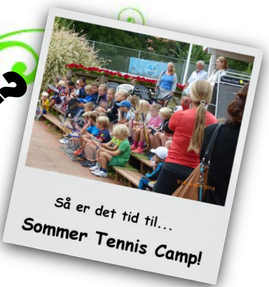
Så er det tid til... Sommer Tennis Camp!

Så er det endelig blevet tid til vores populære Sommer Tennis Camp i Tennis Club Odense for juniorer fra 5-15 år.